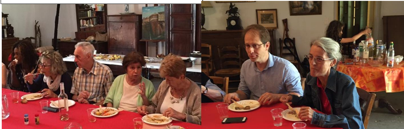
Ambiance fraternelle et conviviale lors du repas mis en commun

Enfin, en nombre, nous avons rejoint la Métairie, chez les Olivier de Scorbiac, pour un sympathique moment où, après un repas tiré des sacs et mis en commun, des informations sur les diverses activités accomplies par les uns et par les autres, ici ou là, ont été présentées tour à tour. Un véritable inventaire à la Prévert, insoupçonné par beaucoup, a permis de découvrir la place de la prière pratiquée par des groupes de tailles diverses, celle de l'étude de la Bible, de l'accompagnement fraternel par l'équipe des visiteurs, etc., etc. Une découverte pour la majorité d'entre nous et, surtout, une invitation adressée à chacun de participer ou d'innover... le tout dans la communion fraternelle et en pleine conscience du privilège qui est le nôtre dans un monde si tourmenté ! L'accueil, le cadre, les échanges,... tout a contribué à faire de ce moment un temps de grâce pour les petits et pour les grands.