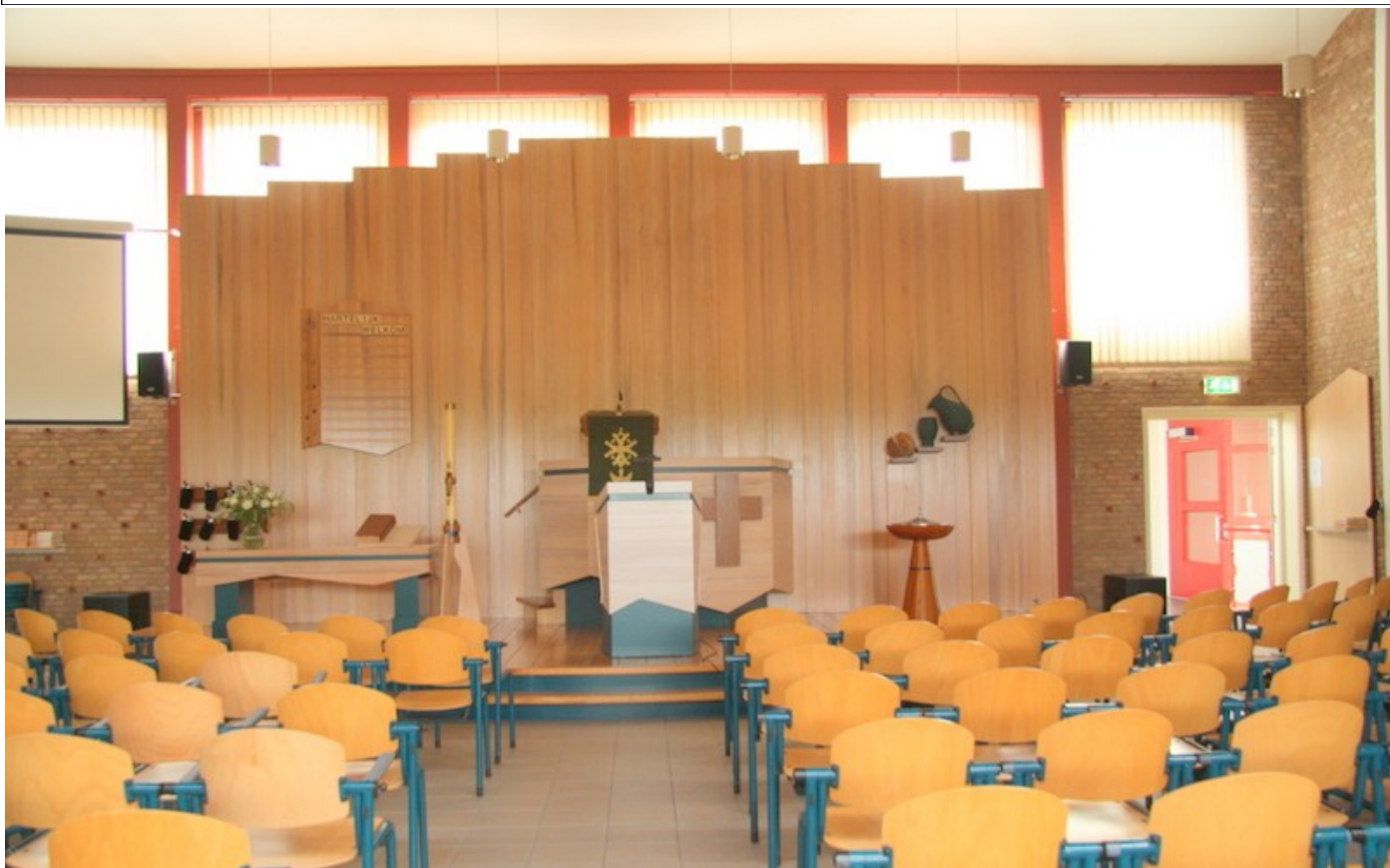
Une vue de l'intérieur de l'Eglise Réformée Evangélique aux Pays-Bas

Géographiquement, le territoire de l'Eglise est divisé en cinq quartiers à l'intérieur desquels sont organisés, par une équipe responsable, le travail pastoral, le diaconat et diverses activités, chacun étant mû par le désir d'être membre d'un secteur rayonnant de l'Evangile. Un rapport sur l'évolution des diverses actions entreprises dans chaque quartier est fait, ensuite, au Conseil Presbytéral.